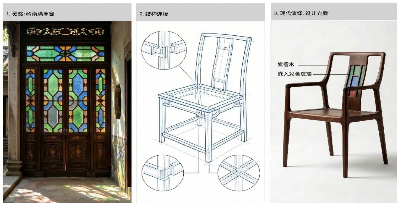
图2 满洲窗元素的椅子转译演化过程

在形态转译阶段，设计以椅子产品为载体，将满洲窗的几何分割逻辑融入椅背与侧边支撑结构之中，并结合参数化建模方法对结构比例进行优化调整，使其满足家具产品在人机尺度、视觉平衡及结构稳定性等方面的需求。同时，通过模块化结构设计增强产品的工业化适配能力，使传统文化元素能够更好地融入现代制造体系，见图2所示。